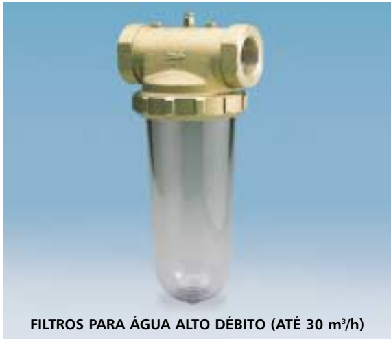
FILTROS PARA ÁGUA ALTO DÉBITO (ATÉ 30 m³/h)