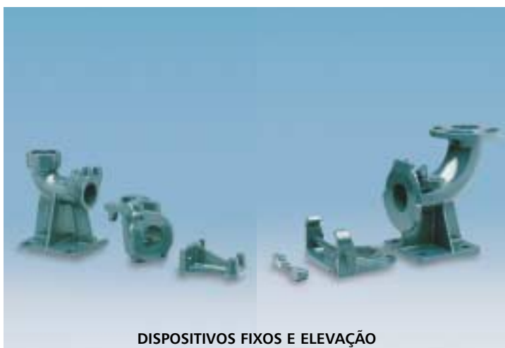
DISPOSITIVOS FIXOS E ELEVAÇÃO