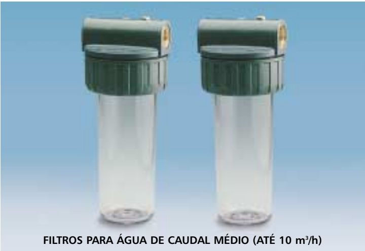
FILTROS PARA ÁGUA DE CAUDAL MÉDIO (ATÉ 10 m³/h)