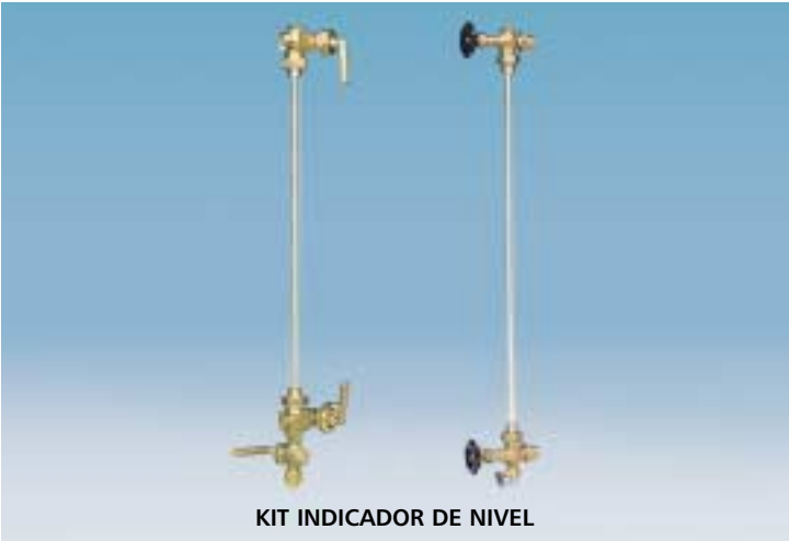
KIT INDICADOR DE NIVEL