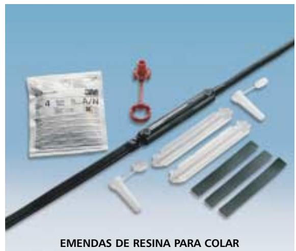
EMENDAS DE RESINA PARA COLAR