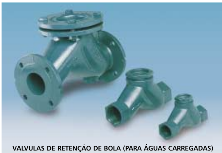
VALVULAS DE RETENÇÃO DE BOLA (PARA ÁGUAS CARREGADAS)