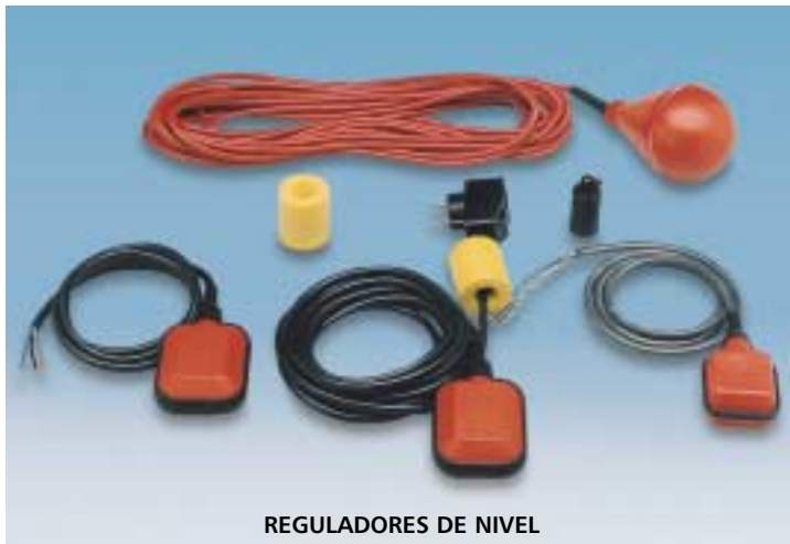
REGULADORES DE NIVEL