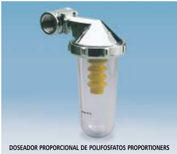
DOSEADOR PROPORCIONAL DE POLIFOSFATOS PROPORTIONERS