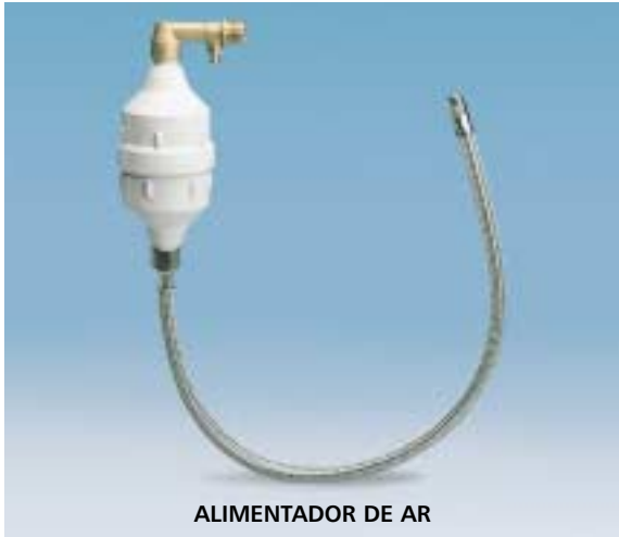
ALIMENTADOR DE AR