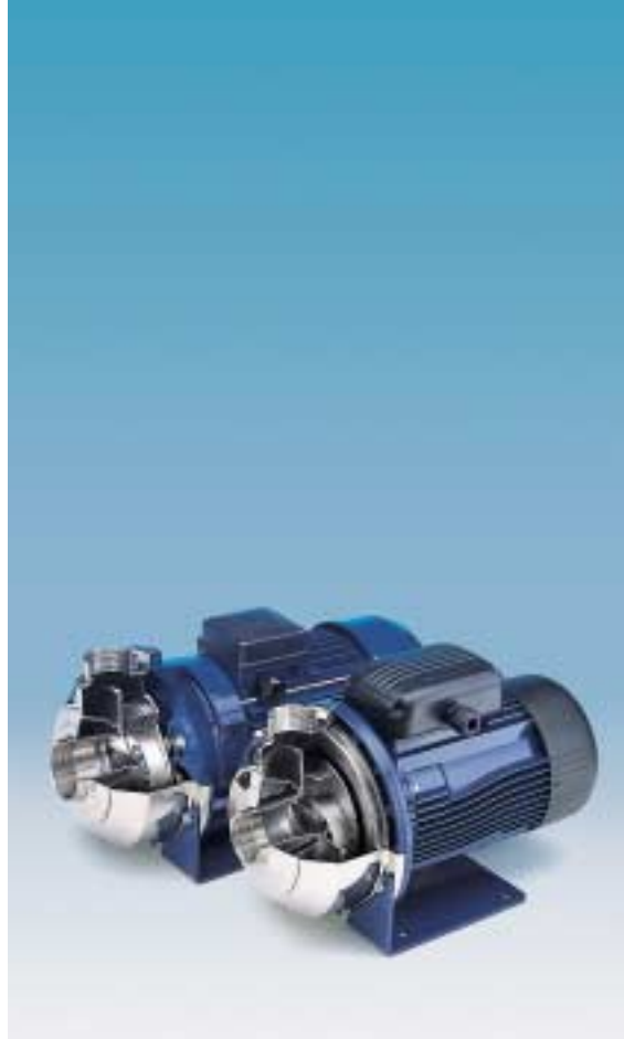
TABELA DE MATERIAIS